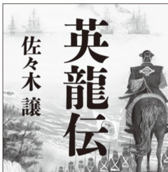
英龍伝 佐々木謙 開国か。戦争か。幕臣。日本を救った。早くから「黒船来航」を予見し、海防強化を訴え続けた異色の行政官・江川太郎左衛門英龍の不屈の生涯。『くろふね』(武揚伝)に連なる幕末3部作、源流の完結! 毎日新聞出版

当時、筆者は、天保二年に直胤が華山の代官所を訪れ、作りしている事実、そして両者に師弟関係があるらしいということに着目し、研究を始めていた。小説は、その少し後に発表されたものである。