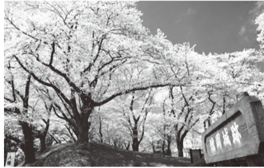
今は桜の名所となっている稚岡城跡

た奥州藤原氏討伐などに武功を立て、さらに蒙古襲来に備えて鎌倉幕府の命により安芸国や肥後国にまで及び、土着していく。 児玉党の一族の多くはこのようにして関西や東北の新天地へ移住していったもので、日本各地の児玉姓は、もともと児玉党の子孫であると聞いている。