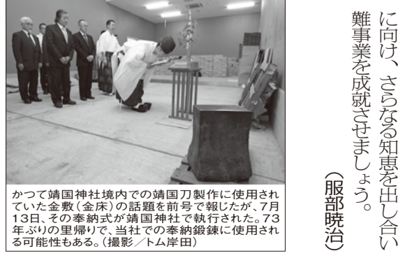
かつて靖国神社境内での靖国刀製作に使用されていた金敷(金床)の話題を前号で報じたが、7月13日、その奉納式が靖国神社で執行された。73年ぶりの里帰り、当社で奉納録録に使用される可能性もある。

後日、友人から聞いた話では、実技の走行で脱輪(昭和世代はこう言いますが、現在はコースアウトと呼ぶらしい)してしまっただけで、免許更新は問題なかったそう。今の教習所はショッピングモールの一部のように洗練されていますが、若者が団塊世代、高齢者ばかりで、三十五十歳代がほとんどいない異様な世界でした。 話が本題から脱輪してしまいましたが、来る「刀剣評価鑑定士」資格認定試験に向けて、さらなる知恵を出し合い、難事業を成就させよう。