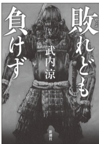
敗れども負けず 武内涼

六月二十四日、足利義教は家臣赤松満祐の屋敷に招かれ、春王・安王対峙の祝宴中、斬り殺されてしまう。第二話は、源氏に滅ぼされる越後平氏の女性の話。第五話は北条政子の話だが、いずれも「敗れども負けず」。勝負は一往たり来たりというところで、ぜひ読んでみてください。(持田具宏)